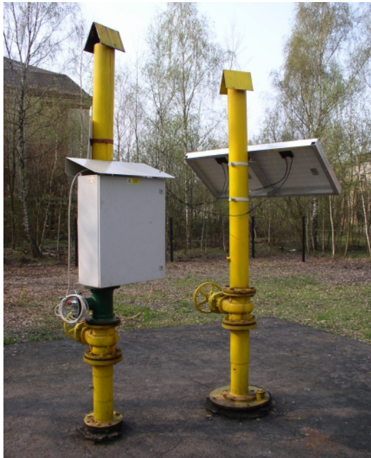
Monitorovací zařízení MARA-2